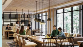
在公共空間備有可清洗餐具等的流理台、投幣式洗衣機、微波爐等。