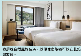
客房採自然風格裝潢，以便住宿旅客可以在此悠閒放鬆。