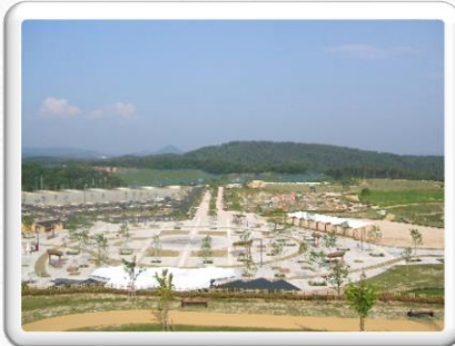
世羅廣島縣立公園